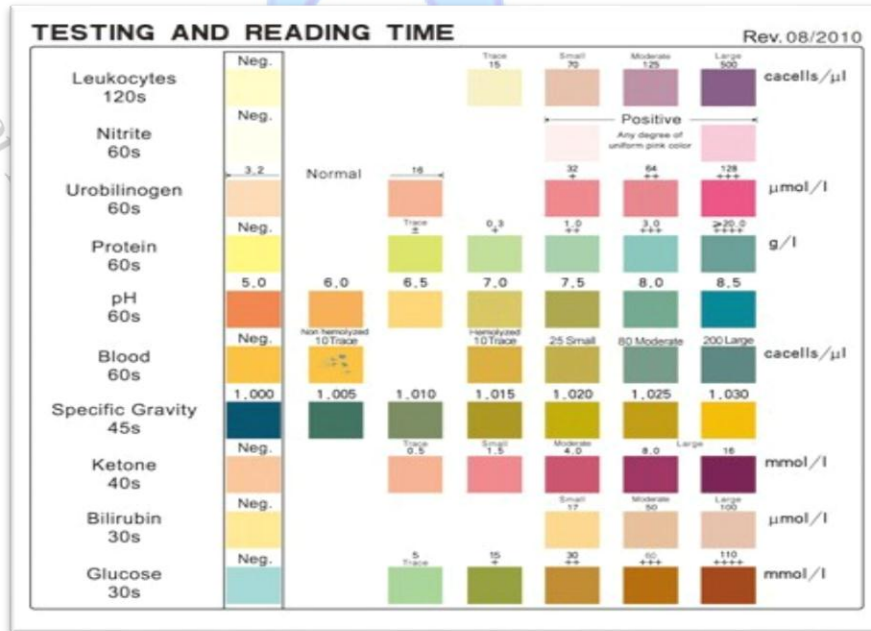
شكل (2) يبين جدول الالوان الذي يبين درجات كل متغير