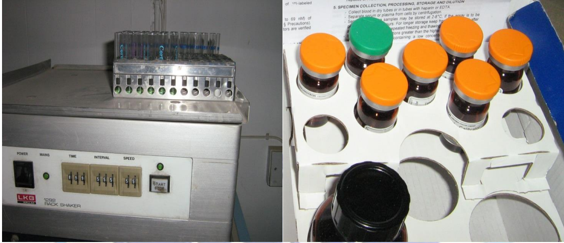
شكل ( 1ب )

قبل الجهد ، ثم تنقل إلى المختبر ليتم فصلها في جهاز الطرد المركزي لاستخراج ( السيرم ، بلازما الدم ) من كل عينة بمساعدة كيميائي متخصص في هذا المجال ثم توضع بعد الفصل في أنابيب مكتوب عليها رقم اللاعب قبل الجهد . ثم تحفظ بعد ذلك في صندوق التبريد ( COOL BOX ) لتنتقل إلى المختبر لإجراء التحليل عليها لمعرفة نسبة تركيز الهرمون في الدم.