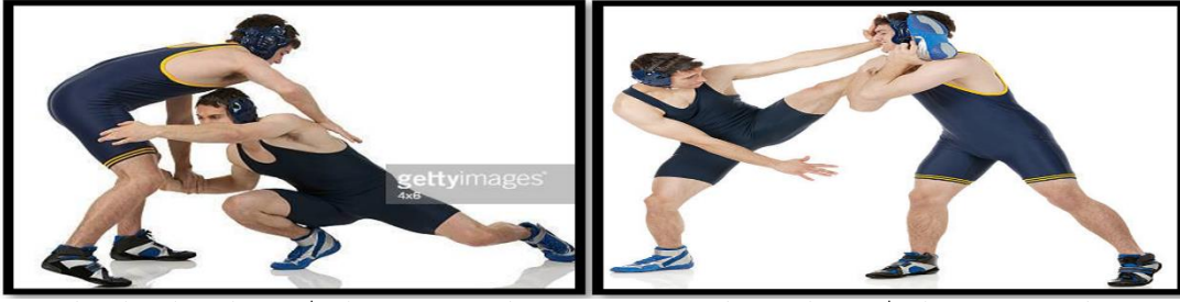
شكل (2) يبين الغطس على رجل واحدة شكل (3) يبين الغطس على كلتا الرجلين